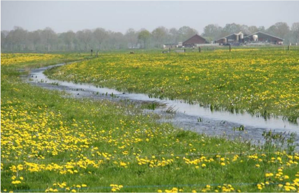
Foto 1: Greppel met hoog waterpeil voor weidevogels